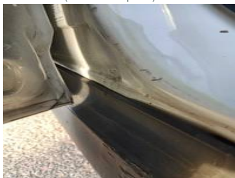
Porte arrière gauche (Défaut aspect)